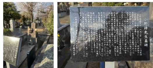
小野梓先生墓所と碑

長安寺の前の小径を東へ入るとそこは谷中霊園である。谷中霊園の北端、日暮里駅に接した天王寺（毘沙門天・天台宗）で毘沙門天に拝謁。天王寺は享保年間には富くじ興行が許可され、湯島天満宮、目黒不動龍泉寺とともに江戸の三富と称され賑わった。幕末の上野戦争では、彰義隊の分営が置かれたことから、本坊と五重塔を残して堂宇を全て焼失、さらに昭和32年の放火心中事件で、五重塔も焼失した。この事件は、幸田露伴の小説、『五重塔』で知られている。天王寺から谷中墓地に戻り墓地番地・甲6号10側