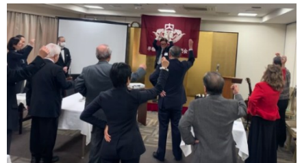
全員で校歌を熱唱